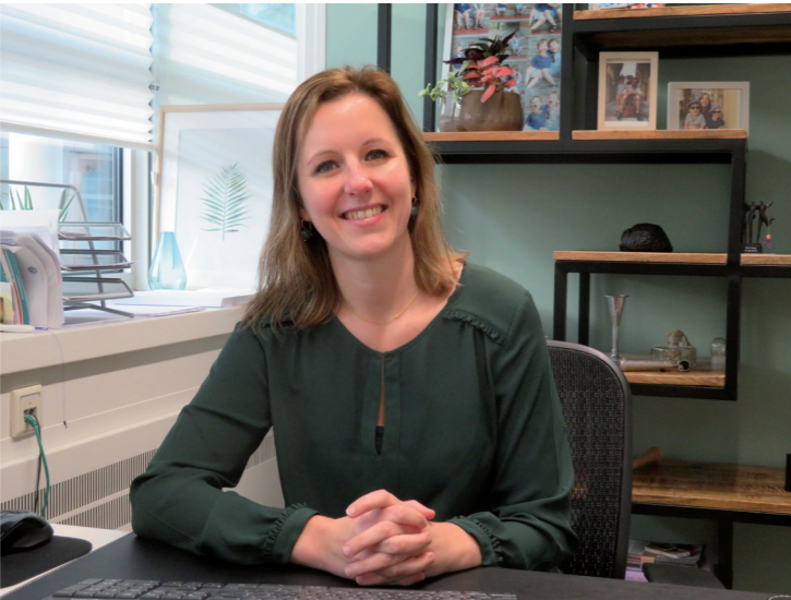
tot maandagochtend, en altijd buiten kantoor tijden en op feestdagen.

'De huisartsenpraktijk is waar je dagelijks voor reguliere en óók voor acute zorg terecht kan. De huisartsenpost is uitsluitend bedoeld voor acute zorg buiten de reguliere tijden om. Acute zorg die niet kan wachten tot de eigen huisarts weer beschikbaar is, bijvoorbeeld iets dat in de avond gebeurt en kan niet wachten tot de volgende ochtend 08.00 uur, of op de zaterdagochtend en het kan niet wachten