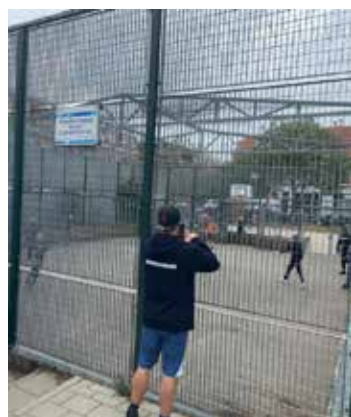
Voetbalkooi, St. Aldegondeplein

Startpunt van het gesprek is de noodzaak van een voetbalkooi op de Houtrustweg, die vanwege de nieuwbouw tijdelijk is weggehaald, maar weer terug zou komen en eerst in augustus en toen in september geopend zou worden, maar waar de werkzaamheden zijn stilgelegd, vanwege een lopend ‘kort geding’ vanwege een aangetekend bezwaar van omwonenden.