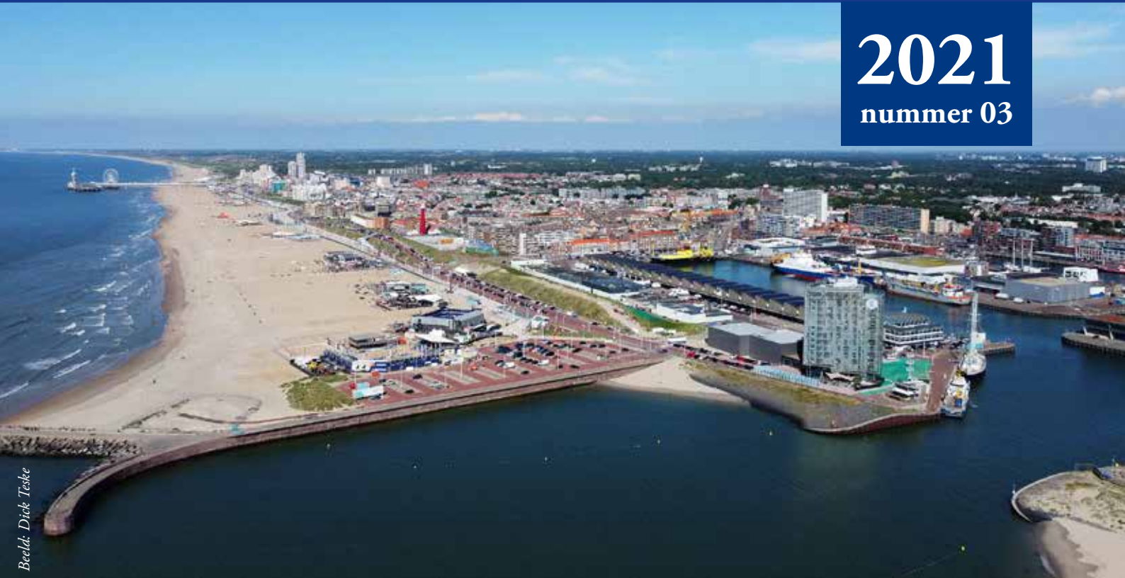
Beeld: Dick Teske