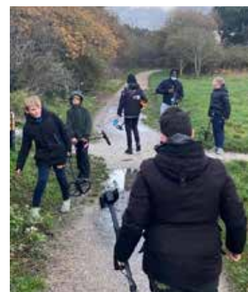
Speurtocht met metaaldetectoren

Het mooie van dit alles is dat de jongerenwerkers, waaronder ook 3de/4de jaar studenten die het als onderwijsstage doen, onze jongeren op allerlei manieren de hand reiken.