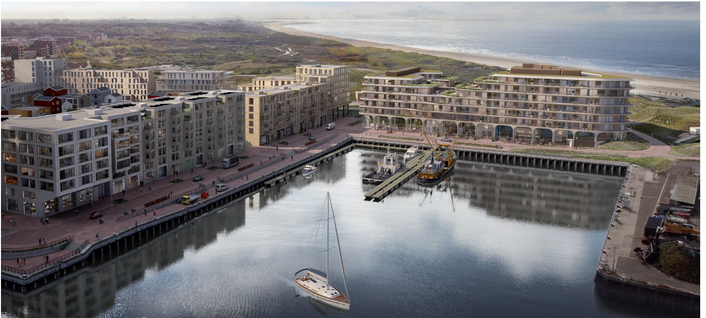
Maresgebouw aan de Derde Haven