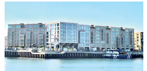
ZuidKade voorzijde aan Hellingkade Derde Haven

Hierna zullen damwanden rondom het Mares-grondoppervlak worden geslagen. Er komt een parkeergarage met twee verdiepingen. Het vrijkomende zand, bij het uitgraven van de parkeergarage, zal worden hergebruikt om het laatste stuk van de Houtrustweg op te hogen ter hoogte van de waterkering Houtrustweg.