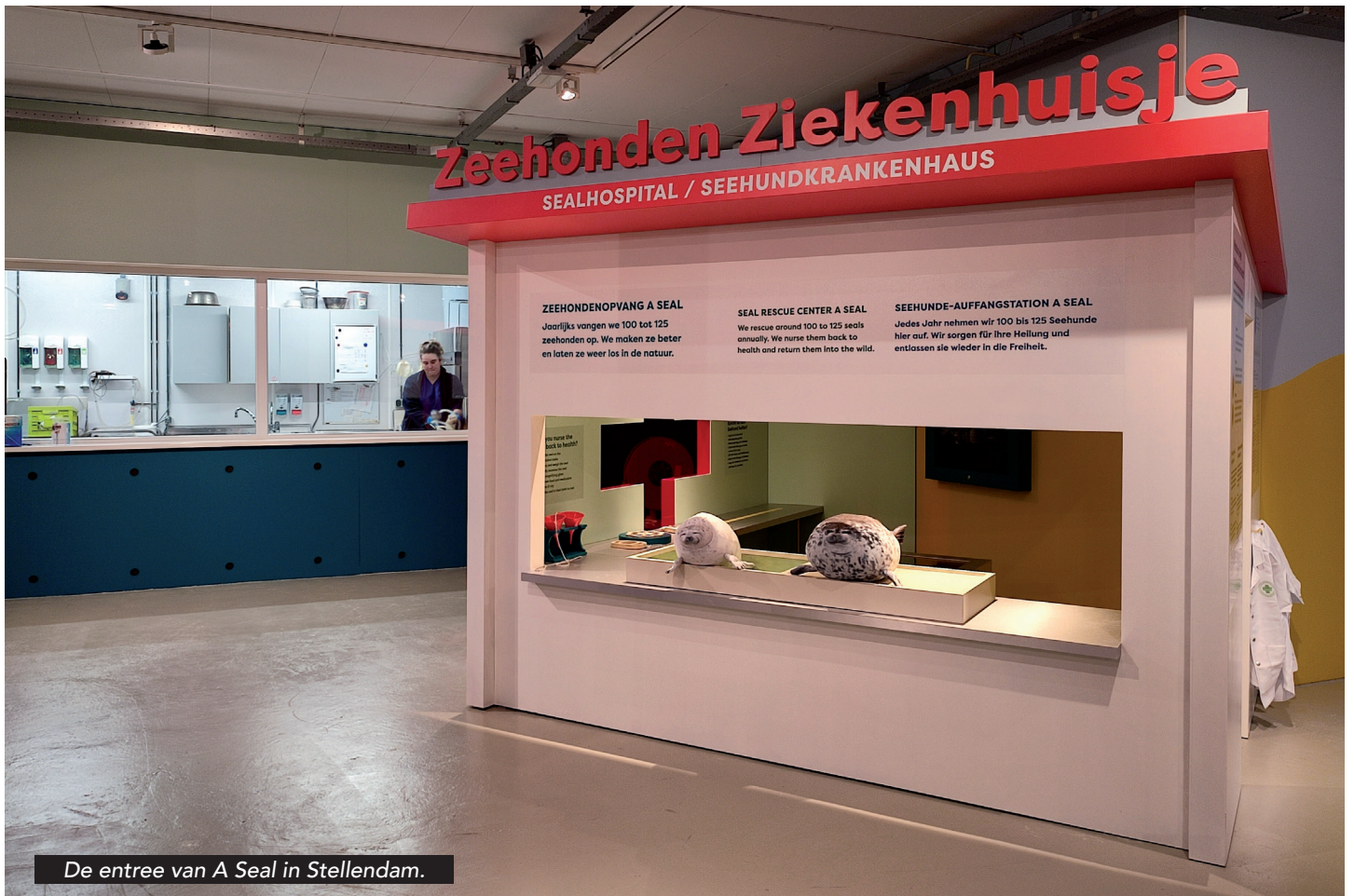
De entree van A Seal in Stellendam.