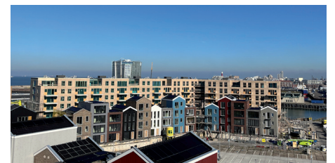
ZuidKade achterzijde met gekleurde huisjes