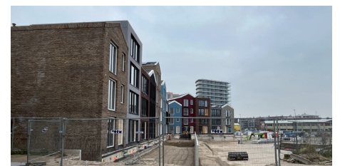
Verlenging Boeistraat achter ZuidKade langs