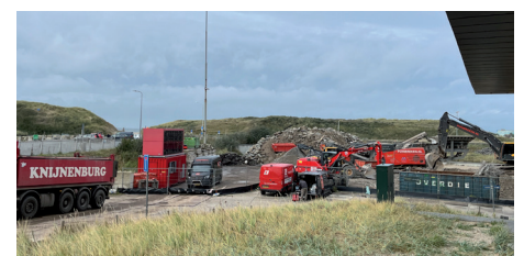
Verwijderen fundament van het Zuiderstrand Theater